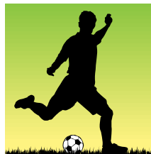
Chiusa la prima fase del nostro concorso. Il tema del mese di novembre: lo e il mio campione preferito

positivi – spiega il responsabile della scuola calcio – e fare capire che diventare calciatore non è cosa da poco, ma serve tanta attenzione e lavoro in campo. Al Catania Nuova i risultati non si ottengono per caso. Cerchiamo di programmare tutto attentamente e in tempo per non farci trova-